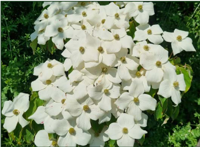
Cornus kousa

Venu des forêts de Colombie, cet arbuste peu commun demande de la chaleur et gagnera à être cultivé en serre, ou en gros pot à rentrer à l'abri pour l'hiver. Donnez-lui un substrat riche et de bons arrosages.