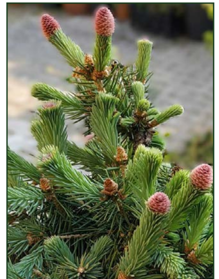
Picea pungens 'Ruby Teardrops'

Venu du froid, cet épicéa apprécie une exposition lumineuse mais non brûlante et une bonne terre de jardin, sur talus, en rocaille ou en pot.