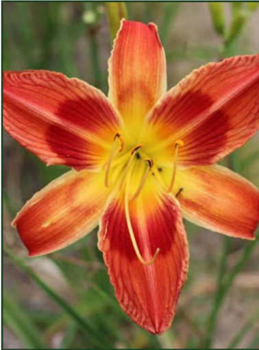
Hémérocailles 'Bille de Clown'