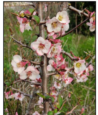
Chaenomeles cathayensis

Bien qu'issu de terrains plutôt acides, ce chinois très rustique s'adapte à tous les sols et ne demande pas de soins.