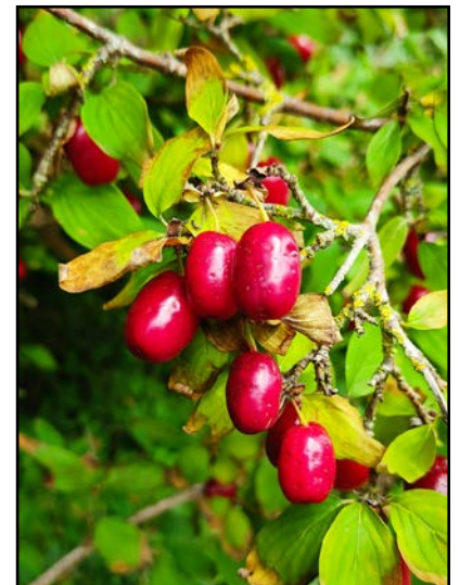
Cornus Mas_©Photo DR

Insensible aux sols ingrats, au froid comme aux coups de chaud, il donne en fin d'été et automne des baies charnues rouge vif qu'il faut consommer très mûres pour apprécier leur goût acidulé. Haut de 2 à 3m au plus, il intégrera au jardin une haie champêtre, un fond de massif ou s'associera élégamment à un tapis d'hellébore hybrides.