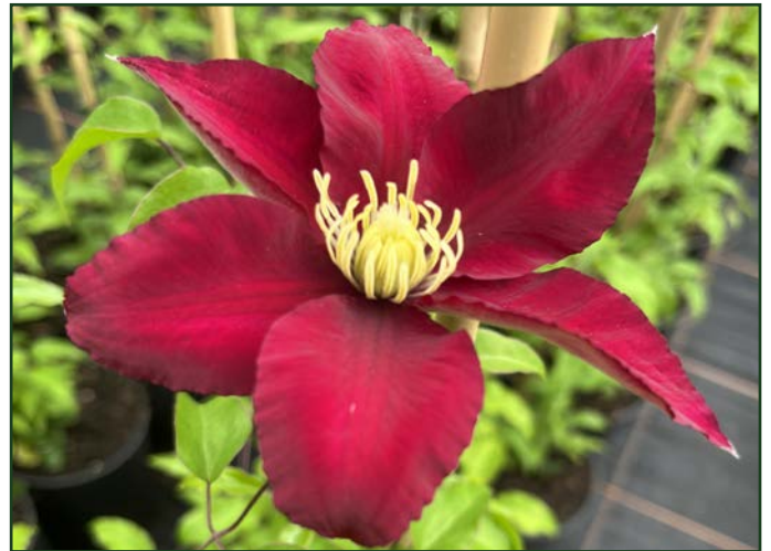
Clématite Elpis (Evigsy 154) ®

Patiemment sélectionné aux Pépinières Le Try - qui fêtent cette année leurs quarante ans - un nouveau cornouiller de Chine ( Cornus kousa ) se distingue de ses frères par un port nettement plus dressé. Il atteint 3m de haut pour 2, 5 m de large, alors que ces cornouillers sont d'ordinaire largement étalés. Répondant au nom d'Alice', il fleurit très abondamment en se couvrant des étoiles blanches à quatre branches, caractéristiques de l'espèce. Le jeune feuillage est légèrement teinté de pourpre et l'arbre flamboie de divers tons cuivre et rouge en automne, quand il porte ses fruits semblables à de grosses framboises. Il apprécie les sols profonds peu ou pas calcaire, et une exposition non brûlante.