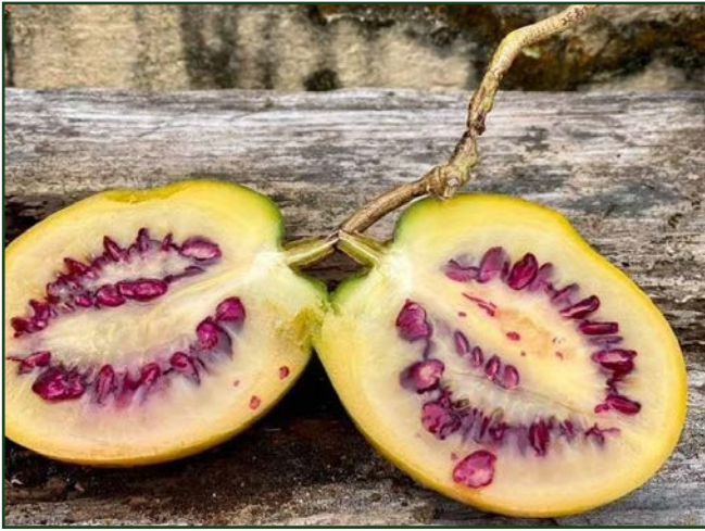
Solanum sibundoyense