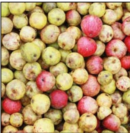
Collection de pommiers_©Le Clos Normand