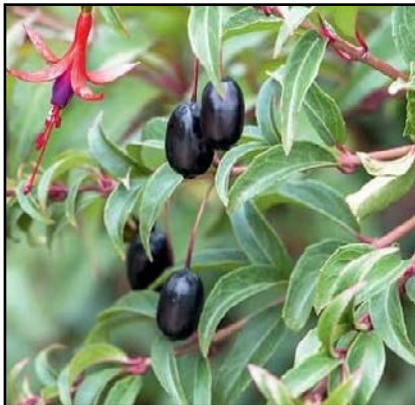
Fuchsia regia 'Regal'