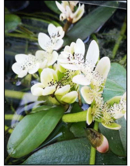
Aponogeton distachyos

Côté table, on les emploie crues, le plus souvent, en complément de salades ou de potages. Malgré son origine, cette espèce s'avère bien rustique, une fois installée au fond de l'eau, et se naturalise même parfois légèrement sans s'avérer envahissante pour autant chez nous.