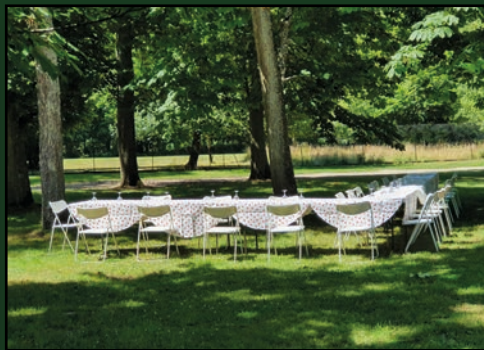
Réceptions Extérieures : 20ha