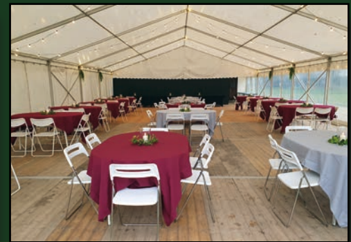
Réceptions sous Barnum : 210m2